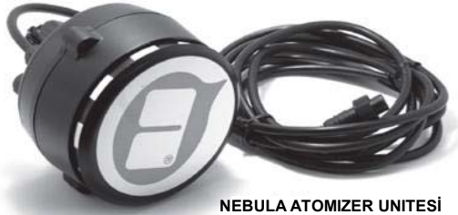
NEBULA ATOMİZER UNİTESİ