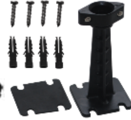
NEBULA MONTAJ AYIĞI, KAUÇUK PED VE VİDALARI